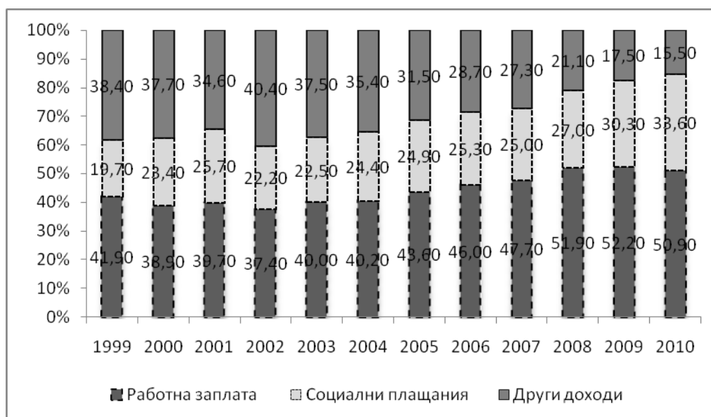
Графика 1. Структура на общия доход на домакинствата за периода 1999 г. – 2010 г.

Този факт още веднъж подчертава значимостта на работната зплата като източник на доходи за домакинствата.