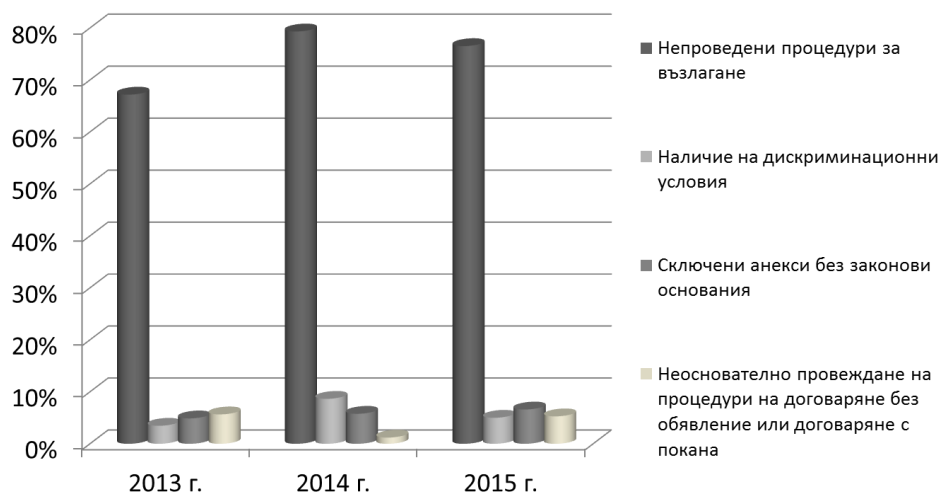
Фигура 2. Относителен дял на обществените поръчки по видове съществени нарушения

Данните за 2015 г. показват, че както и през предходните две години преобладават случаите, в които са сключени договори без да са проведени процедури за възлагане при наличие на всички законови основания за тяхното провеждане - 290 случая или 76,52% (вж. Фигура 2 ). Контролните органи са установили 25 случая (6,60%) на нарушения на чл. 2 от НВМОП (отм.), а при 19 обществени поръчки (5,01%), е констатирано, че възложителите са поставили дискриминационни условия. Не се различава съществено от 2014 г. броят на обществените поръчки, при които е установено, че са сключвани анекси към договори, с които са направени промени, без законови основания за това – 25 случая (6,60%). Неоснователно проведени процедури на договаряне без обявление или на договаряне с покана вместо открити процедури са открити при 20 случая (5,28%). 16