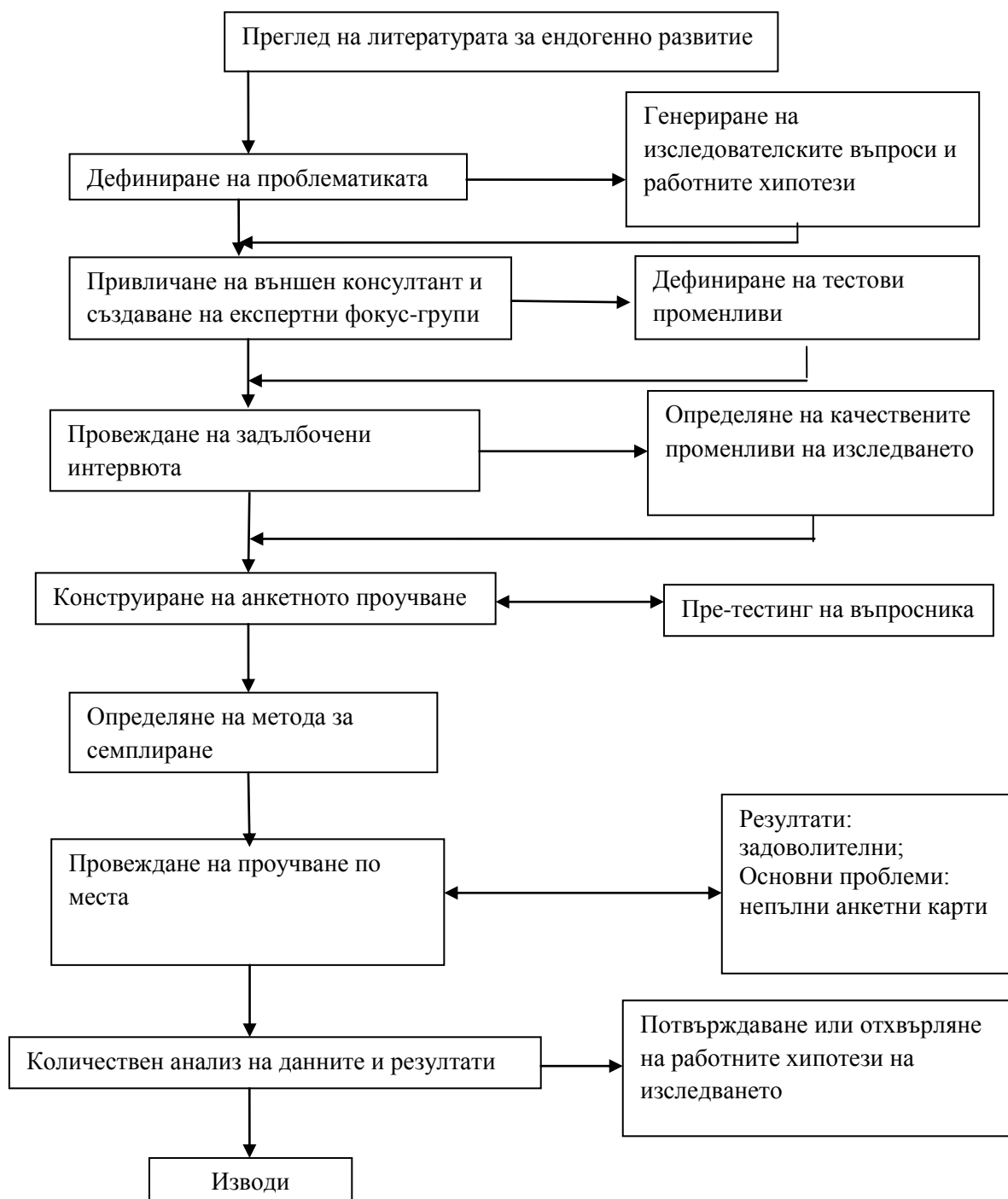
Фиг.1. Схема на изследователския подход.