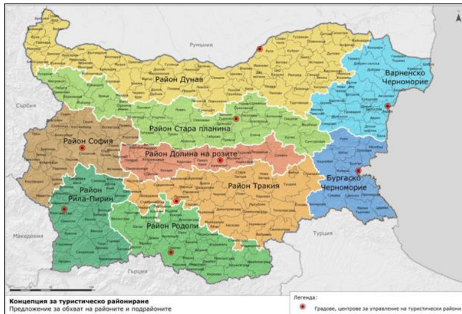
Фигура 1. Обхват на туристическите райони според Концепцията за туристическо райониране на България 9

райони в България е характеризирани със своя основна и разширена туристическа специализация , открояваща самостоятелната им идентичност. Основната специализация е комбинация от два вида туризъм, които в своето съчетание определят уникалността на районите (морски, планински, културен, делови, здравен, селски, религиозен, винен, круизен, еко-туризъм). Разширената специализация включва освен основните и до четири допълващи вида туризъм. 8