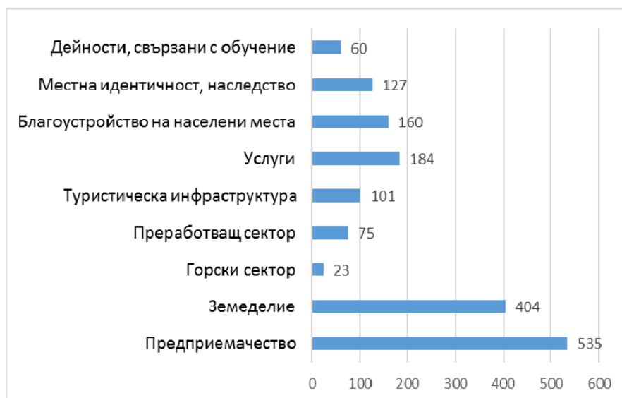
Фиг. 2. Брой финансирани договори по сектори.

Значителен е относителният дял (31,8 %) и на бизнес инициативите в земеделския сектор, следвани от услугите и дейностите по благоустройство на населените места.