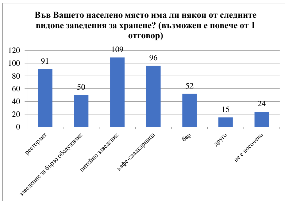
Фигура 5 Налични заведения за хранене

Последният и особено съществен въпрос е свързан с мнението на респондентите относно вида туризъм, който може да бъде развиван в тяхното населено място. Установи се, че най-добри са предпоставките за раз-