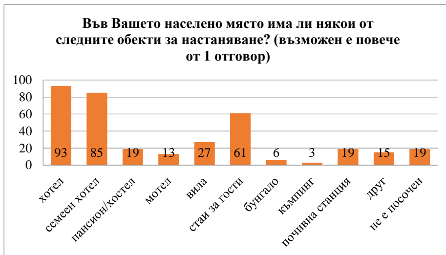
Фигура 4 Обекти за настаняване