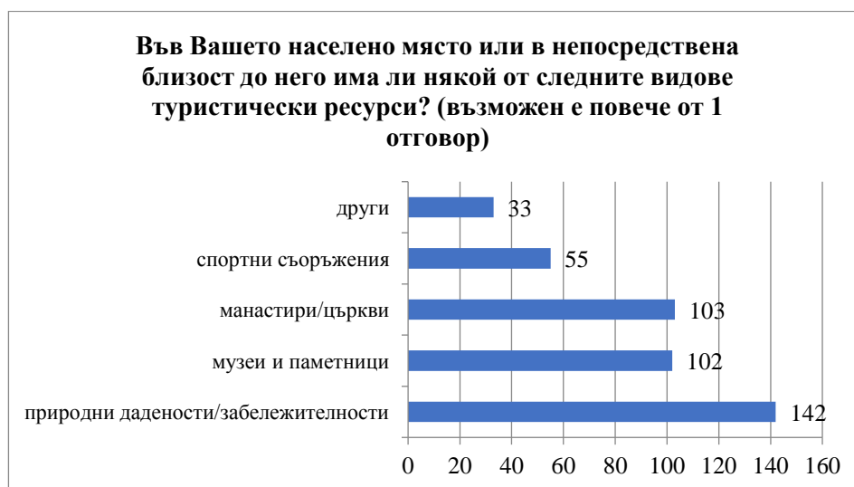
Фигура 3. Наличие на туристически ресурси

посочили манастири и църкви като туристически ресурс. Почти същият брой лица са посочили музеи и паметници. Висок е и броят на тези, които смятат, че в непосредствена близост до населеното им място има спортни съоръжения – 55. Интересно е да се отбележи, че според 33 лица в областта са налични и други, различни от посочените дотук, туристически ресурси (вж. фиг. 3).