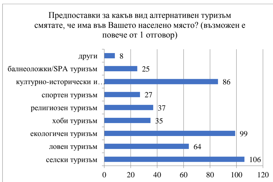
Фигура 6 Предпоставки за алтернативен туризъм

витието на селски, екологичен, културно-исторически и познавателен туризъм. По-малък е дялът на лицата, които сочат наличие на предпоставки за развитие на ловен, религиозен и хоби туризъм. Най-малко лица са на мнение, че има добри предпоставки за развитие на спортен и балнеоложки/SPA туризъм. Налице са условия за развитието и на други видове алтернативен туризъм (вж. фиг. 6).