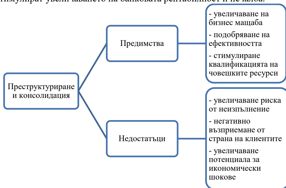
Фигура 1. Предимства и недостатъци пред банковото реструктуриране и консолидация

Сред най-същественото предимство пред банковата консолидация и реструктуриране е възможността, която се предоставя за увеличаване на клиентския мащаб и подобряване на продуктово предлагане, което да подпомага цялостното увеличаване растежа на банката и нейната ефективност. Процесите предоставят възможност за компенсиране на пропуските в човешките ресурси, моделите за управление и цялостно стабилизиране на банковия екип, които да стимулират увеличаването на банковата рентабилност и печалба.