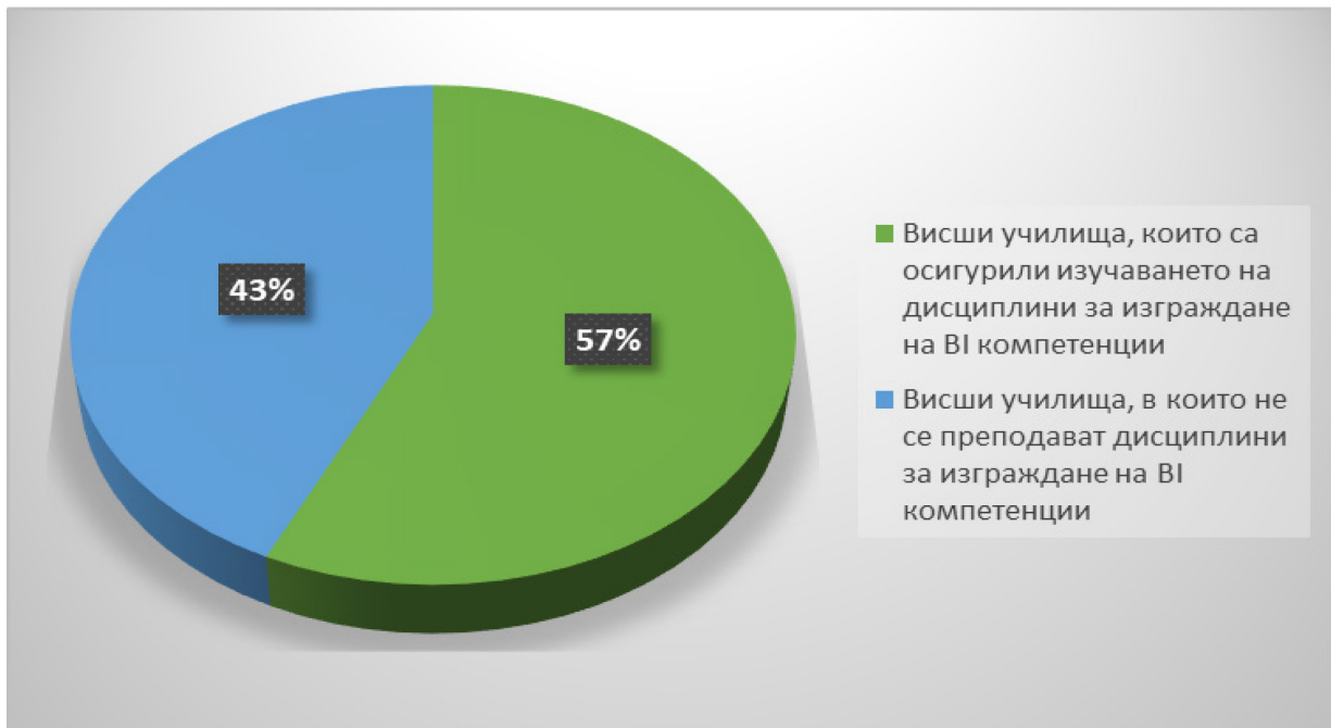
Фигура 2. Посоката на висшите училища в контекста на осигуряването на дисциплини за изграждане на ВІ компетенции

Второ , проучен е относителният дял на висшите училища от Европа, избрани по метода на случайния неповторен подбор спрямо извадката, които за периода 09.2018–09.2022 г. са актуализирали организацията на обучението на бъдещите счетоводители (обучението по счетоводство като процес, основан на съдържателни учебни дейности, включително в интерактивна среда), респ. са извършили навременни актуализации на учебния план и учебните програми и други в хода на изграждането на ВІ (Business Intelligence) компетенции на студентите (вж. Фигура 2):