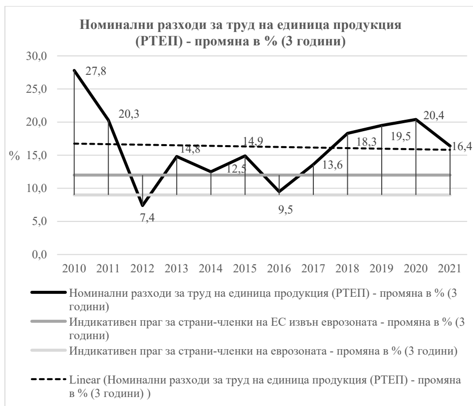
Фигура 3. Номинални разходи за труд на единица продукция на България (промяна в % за период от 3 години) през периода 2010 – 2021 г.

Източник: Ежегодни Доклади за механизма за предупреждение на Европейската комисия; авторови изчисления.