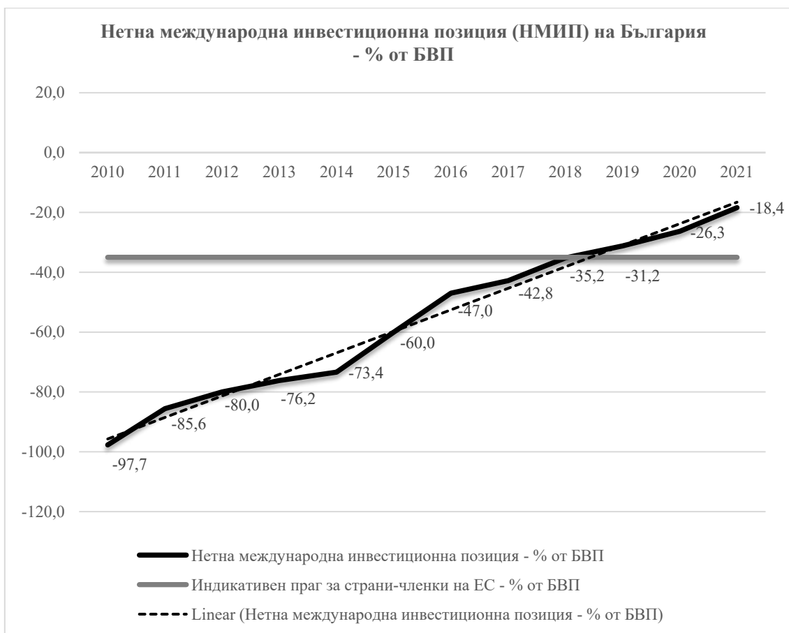
Фигура 2. Нетна международна инвестиционна позиция (НМИП) на България (в % от БВП) през периода 2010 – 2021 г.

платежния баланс. Отрицателната стойност НМИП на България леко се свива до -76,2% от БВП през същата година. При това от 2014 г. подобрието на НМИП се дължи на положителното салдо по текущата сметка и положителното салдо по капиталовата сметка на платежния баланс, както и на увеличаващите се външни активи. Делът на НМИП намалява до -73,4% от БВП на страната през 2014 г. Същевременно, увеличението на дела на България в световния износ забавя темповете си. През 2015 г. отрицателната стойност на НМИП остава над индикативния праг, възлизайки на -60,0% от БВП, но продължава да се подобрява на фона на положителното салдо по текущата сметка на платежния баланс. Делът на експортния пазар се увеличава през последните 5 години, въпреки загубите през 2015 г.