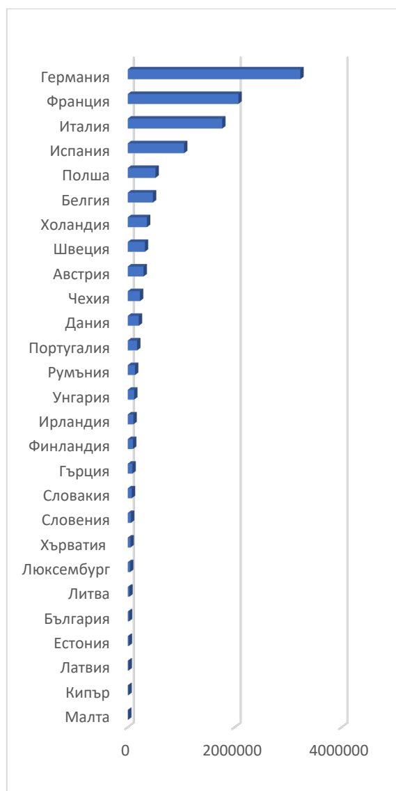
Фигура 3. Продажба на леки автомобили – средно равнище за периода 2007 – 2020 г.