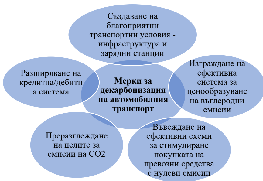
Фигура 1. Мерки за декарбонизация на автомобилния транспорт

Приемането на новия закон за движение по пътищата (Закон за движение по пътищата, 2021) и Националната стратегия за безопасност на движението по пътищата в Република България 2021 – 2030 г. (Министерски съвет, 2020) излагат на преден план редица ключови послания в производството и продажбите на конвенционалните превозни средства, в т.ч. въвеждането на стимули за покупка на нови автомобили и поддържането на добри технически параметри на превозните средства. Това е породено от високата степен на необходимост от използване на енергийни източници (горива) и респективното изпускане на CO 2 във въздуха. Търсенето на варианти за стимулиране намаляването на емисии на парникови газове довежда до локални мерки в различните страни за предприемането на данъчни облекчения (Лилова, Р., Захариев, А., Кръстев, Л. и колектив, 2021) и стимули. Това е следствие на осигуряването на съответствие с поредицата важни регламенти, които трябва да създадат благоприятна рамка за прехода към климатична неутралност. Съгласно Европейската асоциация на производителите на автомобили (АСЕА) постигането на декарбонизация на автомобилния транспорт може да се постигне чрез прилагането на следните мерки, изведени във Фигура 1: