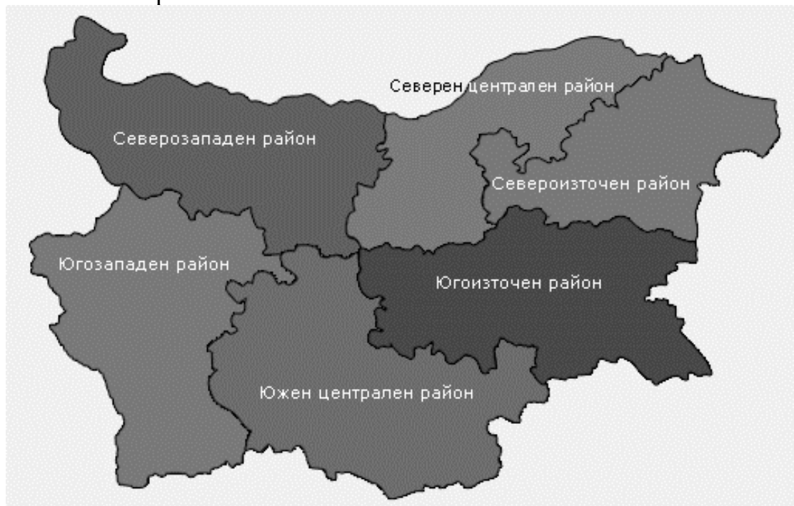
Фигура 1. Разпределение на районите за планиране в България

Според класификацията на териториалните единици за статистически цели в България (NUTS 2) (Павлова, 2021) страната е разделена на шест района за планиране: Северозападен, Северен централен, Североизточен, Югоизточен, Южен централен и Югозападен. В тях са разпределени и 28-те области на страната.