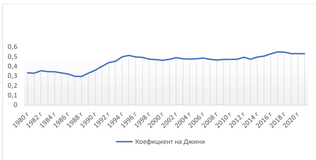
Фигура 1. Неравенство на доходите в България за периода 1980–2022 г..