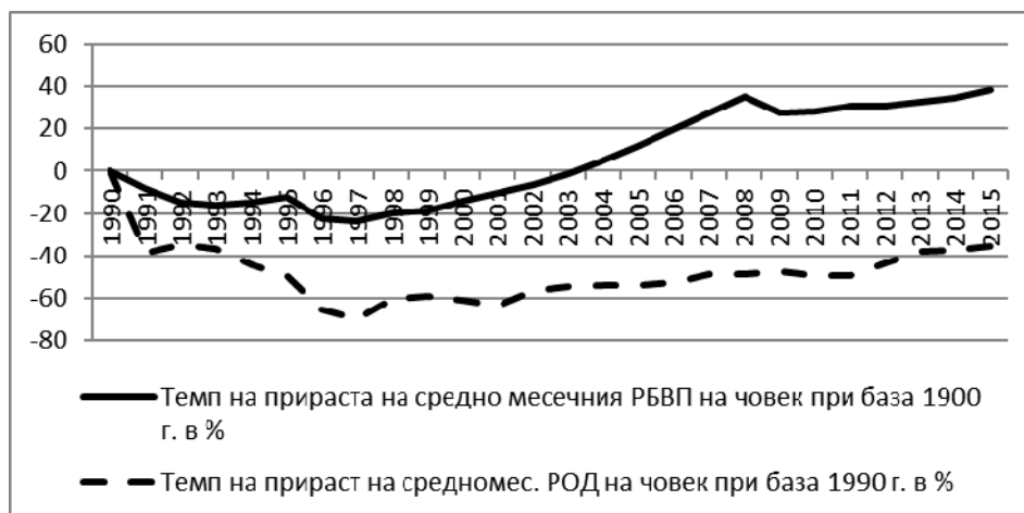
Фиг. 1. Изменение на средномесечния реален БВП и на реалния общ доход на човек в България (в лв.) през периода 1990-2015 г. Източник: По данни на НСИ и изчисления на автора

За целите на настоящото изследване на икономическото благосъстояние, разглеждано като връзка между условията на живот и степента на задоволяване на потребностите на домакинствата, се използват показателите общ доход и общ разход на домакинствата ,