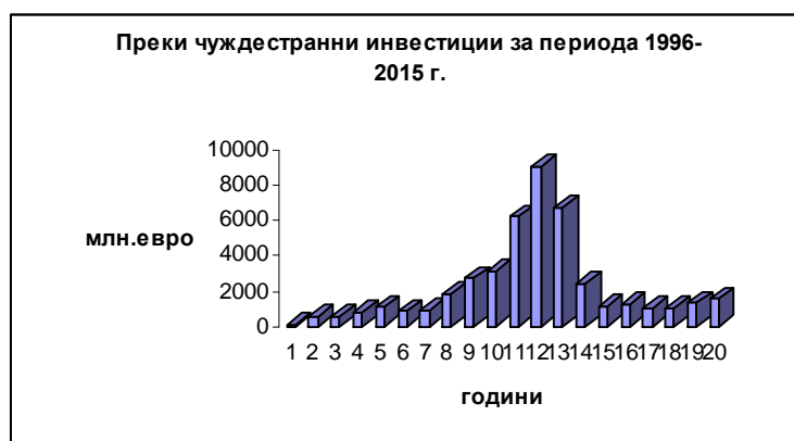
Фиг. 2. Преки чуждестранни инвестиции в страната

Глобалната криза от 2009 г. обхвана целия американски финансов и застрахователен сектори, и много бързо се разпространи в целия свят, което доведе до проблеми в световното банкиране и застраховане. Проектирайки се върху българска почва тази криза има много измерения. Необходимо е да се отбележи, че в последните години до настъпването на глобалната криза националната икономика бележеше ръст, като в последните три години той се колебаеше между 6 -7%. Някои икономически сектори отбелязаха истински бум. Сред тях са строителство, търговия с недвижими имоти, туризъм, услуги и др.