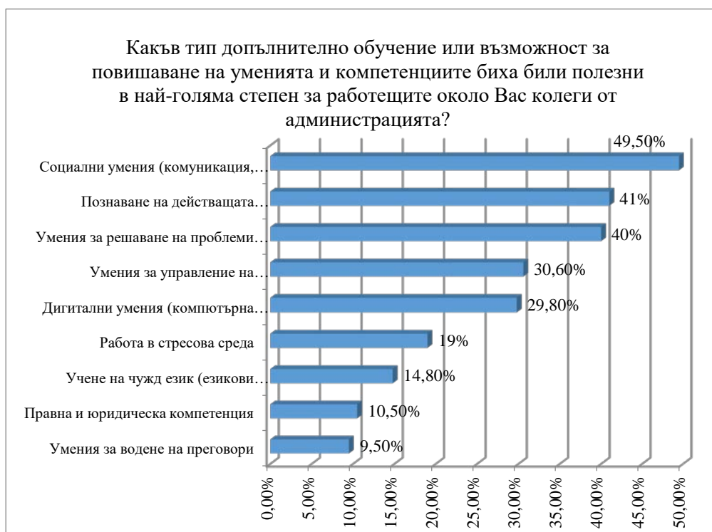
Фигура 4. Преценка за необходимостта от допълнително обучение на колегите