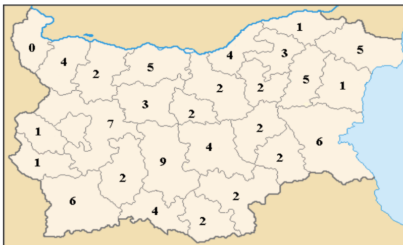
Фигура 1. Брой планирани одити на съответствието с обхват проверка на процедурите по общественни поръчки за периода 2012–2016 г. 5

периода 2012–2016 година най-много планирани ОС с обхват процедури по общественни поръчки има в област Пловдив – девет (вж. фиг. 1). В София област са включени в годишната програма седем, а в две области (Благоевград и Бургас) са планирани шест одита. В останалите области те са с по-малък брой, средно са по два – три, а има и области с по един одит . В област Видин, за последните пет години, Сметната палата не е планирала да извършила ОС с обхват процедури по общественни поръчки. Интересно за тази област е, че в нея не са планирани и тематични одити (вж. фиг. 2).