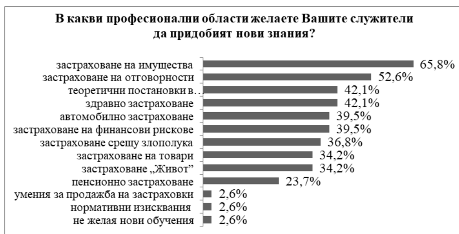
Фигура 11. Предпочитан тематичен обхват на продължаващите обучения