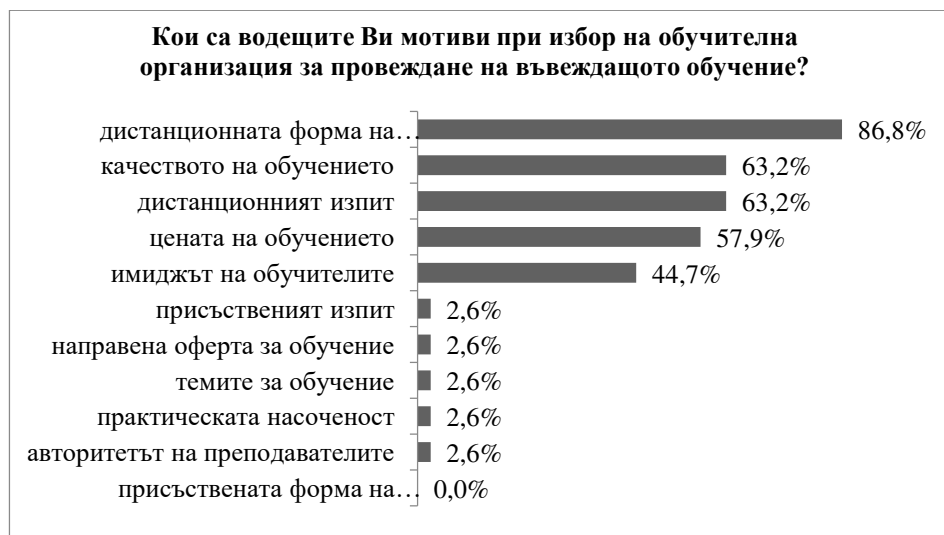
Фигура 6. Мотиви за избор на обучителна организация за провеждане на въвеждащото обучение

Водещите мотиви при избора на обучителна организация за провеждане на въвеждащото обучение са предлаганата дистанционна форма на обучението, качеството на предлаганото обучение, предлаганото дистанционно провеждане на изпита, цената на обучението, имиджът на обучителната организация (вж. Фигура 6).