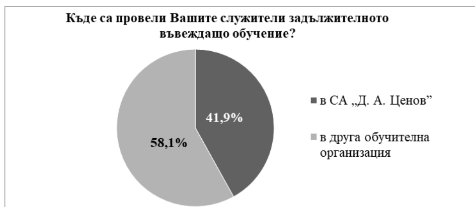
Фигура 5. Дял на анкетиранияте брокери според избора на обучителна организация за провеждане на въвеждащото обучение

От участвалите в анкетното проучване брокери, осигурили въвеждащо обучение на своите служители, 42% са избрали СА „Д. А. Ценов“ за обучителна организация, а 58% са ползвали услугите на някоя от другите 12 обучителни организации (вж. Фигура 5).