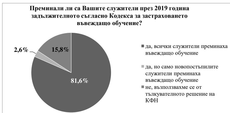
Фигура 4. Дял на участвалите в анкетното проучване брокери на база изпълнението на задължението за осигуряване на въвеждащо обучение на своите служители

На въпроса дали служителите им са преминали през 2019 година задължителното съгласно Кодекса за застраховането въвеждащо обучение, утвърдително отговарят 32 от участвалите в анкетното проучване брокери, като един от тях е организирал такова обучение само за новопостъпилите през 2019 година, а останалите са обучили всички свои служители, непосредствено заети с разпространението на застрахователни продукти (вж. Фигура 4).