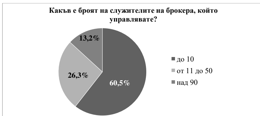
Фигура 2. Дял на участвалите в анкетното проучване брокери на база броя на техните служители

до 50 души са 10 броя. Пет от брокерите са с численост на персонала над 90 души (вж. Фигура 2).