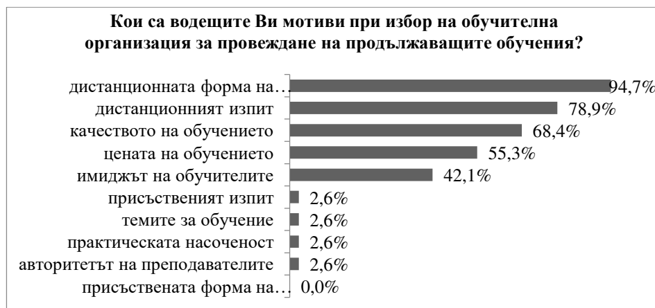
Фигура 7. Мотиви за избор на обучителна организация за провеждане на продължаващите обучения

Предвид липсата на предварителни нормативни изисквания към обучителните организации и обучителите за провеждане на продължаващите обучения интерес представлява да се проучи мнението на брокерите относно техните критерии за избор на обучаваща организация. На база получените отговори на анкетата се установява, че мотивите при избора на обучителна организация за провеждане на поддържащите обучения са аналогични на тези по отношение на въвеждащото обучение – предлаганата дистанционна форма на обучението, предлаганото дистанционно провеждане на изпита, качеството на предлаганото обучение, цената на обучението, имиджът на обучителната организация (вж. Фигура 7). В дадената възможност за свободен отговор част от брокерите към мотивите са добавили още предвидените теми за обучение, придаването на практическа насоченост на обучението, авторитета на преподавателите. Сборът от процентите е над 100%, тъй като е дадена възможност за повече от един отговор на поставения въпрос.