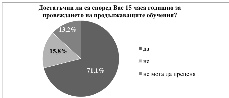
Фигура 10. Преценка за нормативно изискуемата продължителност на продължаващите обучения

ване, автомобилното застраховане, застраховането на финансови рискове. Забелязва се, че не малка част от брокерите считат, че служителите им имат пропуски по отношение на теоретичните основи на застраховането и желаят, продължаващите обучения да обхващат и тази област. В дадената възможност за свободен отговор част от брокерите към предварително зададените възможности за избор са добавили още придобиването на умения за продажба на застраховки и познаване на нормативните изисквания относно актуалните регулации на застрахователния пазар. Един от анкетираните брокери не желае да има законово изискуеми продължаващи обучения, тъй като и без нормативна регулация той има практика да обучава служителите си. Сборът от процентите е над 100%, тъй като е дадена възможност за повече от един отговор на поставения въпрос.