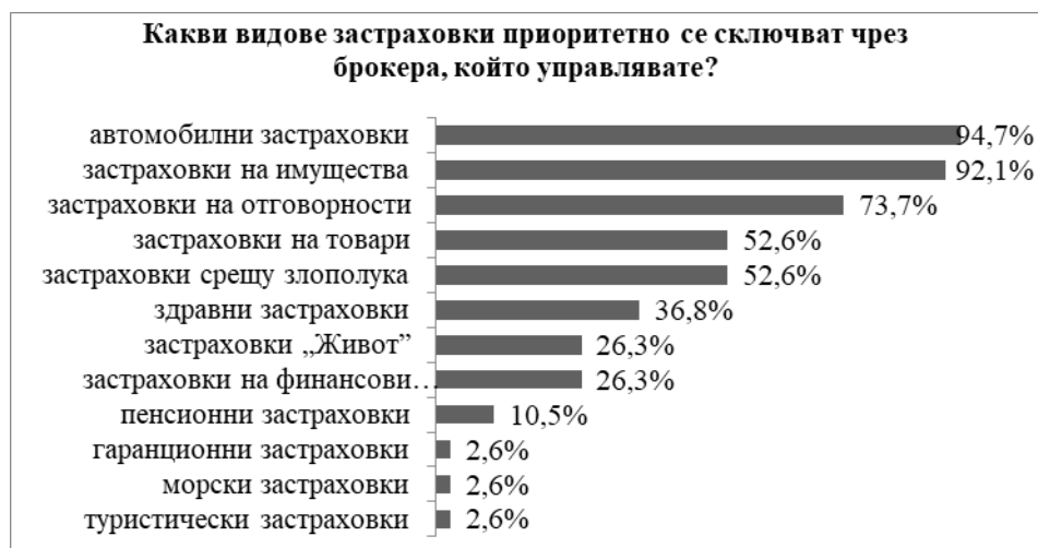
Фигура 3. Предмет на дейност на анкетираните брокери

Що се касае до предмета на дейност, участвалите в анкетното проучване брокери посредничат основно при сключването на масовите за българския пазар застраховки – застраховките на автомобили, имущества и отговорности (вж. Фигура 3).