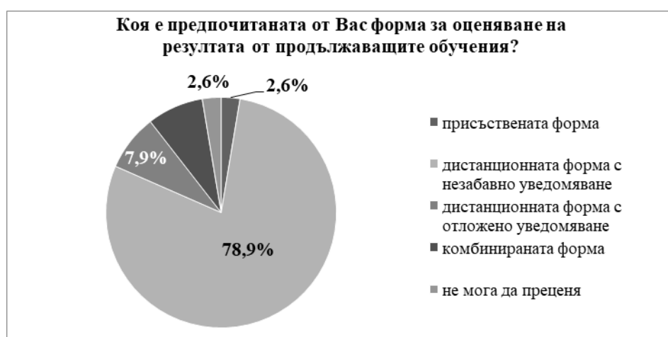
Фигура 9. Предпочитана форма за оценяване на резултата от продължаващите обучения

Кодексът за застраховането регламентира продължителността на продължаващото професионално обучение на поне 15 часа годишно. В тази връзка е проучено мнението на брокерите, дали според тях тази продължителност е достатъчна от гледна точка придобиването на професионални знания и умения. Преобладава мнението, че нормативното изискване е приемливо (вж. Фигура 10). Положително са отговорили 27 (или 71,1%) от участвалите в анкетирането брокери. Шест от брокерите смятат, че 15 часа годишно не са достатъчни за провеждането на продължаващите обучения, а пет от анкетираните не могат да направят преценка по този въпрос.